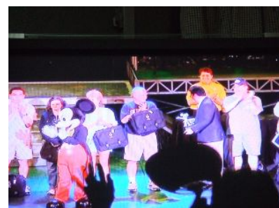
表彰式にはミッキーも登場! で、大盛り上がり!!!